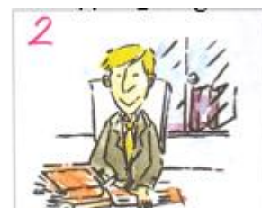
美国人/律师/律师行